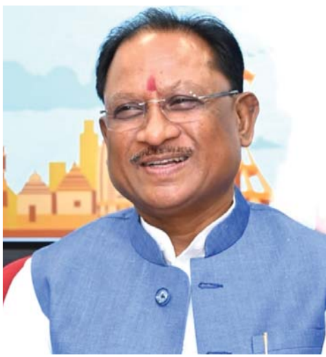
आवास एवं पर्यावरण मंत्री ओ.पी. चौधरी ने कहा कि मुख्यमंत्री विष्णु देव साय के नेतृत्व में राज्य सरकार निवेशकों के लिए पारदर्शी, भरोसेमंद और विकासोन्मुख

मुख्यमंत्री विष्णु देव साय ने कहा कि राज्य सरकार का प्रत्येक निर्णय विकास को गति देने और जनहित में व्यावहारिक समाधान उपलब्ध कराने की सोच से प्रेरित है। हज़रत योजना-2026 इसी दिशा में एक महत्वपूर्ण पहल है। इससे निवेशकों का विश्वास मजबूत होगा, लंबित प्रकरणों का निराकरण होगा और नवा रायपुर के समग्र एवं नियोजित विकास को नई गति मिलेगी।