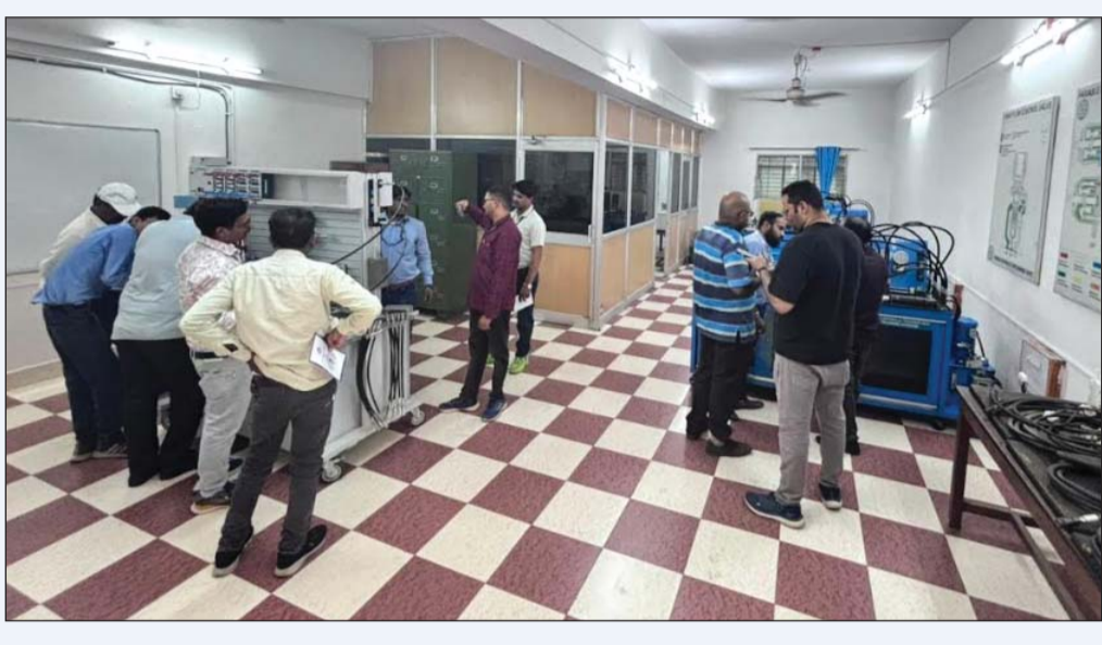
प्रशिक्षण कार्यक्रम के दौरान प्रतिभागियों को आधुनिक औद्योगिक हाइड्रोलिक्स प्रणालियों के संचालन, अनुरक्षण एवं समस्या-विश्लेषण से संबंधित सैद्धांतिक एवं व्यावहारिक

श्रीकंचनपथ न्यूज भिलाई। भिलाई इस्पात संयंत्र के मानव संसाधन-ज्ञानार्जन एवं विकास विभाग द्वारा भारत सरकार के सूक्ष्म, लघु एवं मध्यम उद्यम मंत्रालय (एमएसएमई) के अंतर्गत संचालित एमएसएमई टेक्नोलॉजी सेंटर, दुर्ग के सहयोग से एडवांस्ड इंडस्ट्रियल हाइड्रोलिक्स प्रशिक्षण कार्यक्रम का आयोजन किया गया। तीन दिवसीय इस प्रशिक्षण कार्यक्रम का उद्देश्य संयंत्र के अभियंताओं एवं अनुरक्षण कर्मियों की तकनीकी दक्षता को और अधिक सुदृढ़ बनाना तथा उन्हें आधुनिक औद्योगिक हाइड्रोलिक्स प्रणालियों, अनुरक्षण तकनीकों एवं प्रभावी समस्या-निवारण पद्धतियों का व्यावहारिक प्रशिक्षण प्रदान करना था।