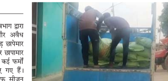
जब्त उर्वरक को सेवा सहकारी समिति तमनार में सुरक्षित रखा गया है।

इसी क्रम में रायगढ़ जिले के बिकसाखंड तमनार में कृषि विभाग ने बड़ी कार्रवाई करते हुए सकी जिले के बाराद्वार से तमनार के भालुमुड़ा तक ले जाई जा रही 52 बोरी डीएपी खाद जब्त की है। कार्रवाई के दौरान परिवहन में उपयोग किए जा रहे वाहन क्रमांक सीजी-11-एबी-3152 को भी कब्जे में लिया गया। जब्त वाहन को सुरक्षित अभिरक्षा के लिए थाना तमनार में रखा गया है, जबकि