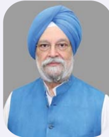
हरदीप सिंह पुरी

प्रधानमंत्री नरेंद्र मोदी पिछले 10 जून को हमारे इतिहास के लगातार सबसे लंबे समय तक सेवा में रहने वाले निर्वाचित प्रधानमंत्री बन गए। इस दरमियान काफ़ी समय तक भारतीय शासन की सेवा करने के नाते मैं कह सकता हूँ कि मोदीजी की उपलब्धि कार्यकाल की लंबाई नहीं है। उन्होंने इस पर रहते हुए जो कुछ किया, वास्तविक इतिहासिक वही है।