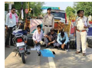
फोन समेत कुल 72 हजार 321 रुपये की संपत्ति जब्त की गई।

महासमुंद। छत्तीसगढ़ में नशीली दवाओं की बड़ी खेप खपाने की साजिश की महासमुंद पुलिस ने ओडिशा-छत्तीसगढ़ बॉर्डर पर ही नाकाम कर दिया। सटीक मुखबिर सूचना, त्वरित नाकेबंदी और एंटी नारकोटिक टास्क फोर्स तथा थाना कोमाखान पुलिस की संयुक्त कार्रवाई में तीन कथित नशा तस्करों को गिरफ्तार किया गया। आरोपियों के कब्जे से 815 नग SPASMO PROXYVON Plus कैप्सूल, परिवहन में प्रयुक्त मोटरसाइकिल और चार मोबाइल