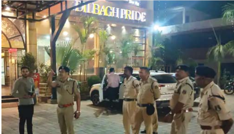
पार्किंग लाइट चालू रखने के निर्देश दिए गए, अभियान के दौरान पुलिस ने साफ किया कि ताकि सड़क हादसों की आशंका कम हो सके। बिना वैधानिक अनुमति के किसी भी ढाबे या

पुलिस ने संचालकों और वाहन चालकों को चेतावनी दी कि भारी वाहनों और ट्रकों को राष्ट्रीय राजमार्ग के किनारे अनियंत्रित तरीके से खड़ा न किया जाए। वाहनों को केवल निर्धारित पार्किंग स्थल पर खड़ा करने और पार्किंग के दौरान