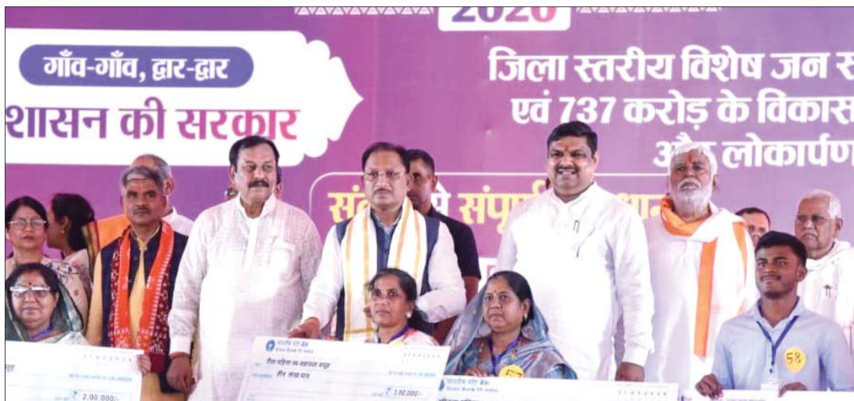
दुर्ग जिले को 739 करोड़ 38 लाख रुपए की लागत के विकास कार्यों की सौगात देते हुए 251 लोककल्याणकारी कार्यों का लोकार्पण एवं भूमिपूजन किया। इनमें 362 करोड़ 46 लाख रुपए की लागत के 98 विकास कार्यों का लोकार्पण तथा 376 करोड़ 92 लाख रुपए की लागत के 153 नए विकास कार्यों का भूमिपूजन एवं शिलान्यास शामिल है।

दुर्ग। सुशासन केवल योजनाएँ बनाने तक सीमित नहीं है, बल्कि सरकार का दायित्व है कि वह जनता के बीच जाकर अपने कार्यों का हिसाब दे, उनकी समस्याएँ सुने और समाधान सुनिश्चित करे। इसी सोच के साथ राज्य सरकार सुशासन तिहार के माध्यम से आमजन के बीच पहुंचकर अपना रिपोर्ट कार्ड प्रस्तुत कर रही है। मुख्यमंत्री श्री साय ने आज दुर्ग जिले के स्वर्गीय झारुआ देवांगन शासकीय बहुउद्देशीय उच्चतर माध्यमिक विद्यालय मैदान में आयोजित सुशासन तिहार 2026 अंतर्गत जनसमस्या निवारण शिविर को संबोधित करते हुए यह बात कही।