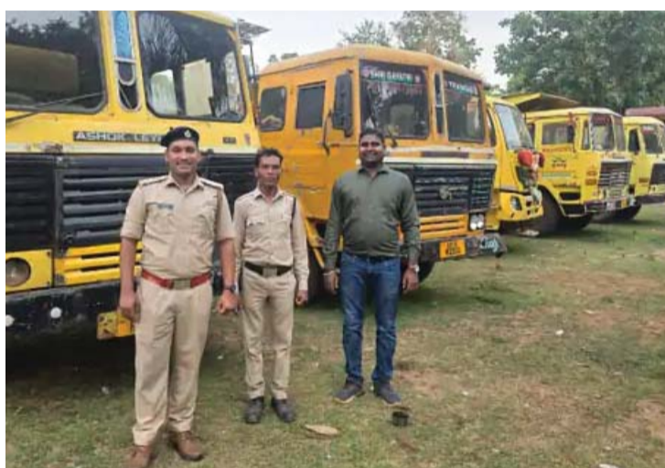
जांच दल ने उपनपाल, देवड़ा, कोडेनार, बड़ेआमाबाबल, कोरपाल, बस्तर,

दरअसल, जिला खनिज जांच उद्घरण दल ने अलग-अलग क्षेत्रों में लगातार औचक निरीक्षण कर कार्रवाई की।