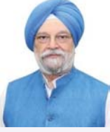
हरदीप सिंह पुरी

जहां तक सोने की खरीद पर संयम का सवाल है तो उससे देश में गहरा भावनात्मक लगाव जुड़ा रहा है। सोना हमारी संस्कृति, परंपरा, बचत और पारिवारिक समारोहों में गहरे तक शामिल रहा है। लेकिन सदियों से सम्मोहित करते सोने का आयात विदेशी मुद्रा भंडार पर गहरा असर डालता है। ऐसे में राष्ट्र हितों के मद्देनजर जीवन यापन करना, राष्ट्रीय कर्तव्य निभाते हैं। विगत में कई बार जब देश पर संकट आया तो लोगों ने राष्ट्र की संरक्षता की रक्षा के लिये सोना तक दान किया। आंकड़े बताते हैं कि देश में हर साल छह सौ से सात सौ टन सोना आयात होता है, लेकिन निर्यात का प्रतिशत ना के बराबर है। बताया जाता है कि देश का नब्बे फीसदी सोना आयात होता है। यह सोना अर्थव्यवस्था में सक्रिय न होकर घरों में एकत्र हो जाता है। एक अनुमान के अनुसार देश के घरों में करीब 27 हजार टन सोना जमा है। बड़ी मात्रा में डॉलर खर्च करके आयात होने वाला सोना देश के चालू खाते और विदेशी मुद्रा भंडार पर प्रतिकूल असर डालता है। ऐसे में सोने पर संयम अर्थव्यवस्था को संबल देने में मददगार हो सकता है।