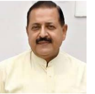
डॉ. जितेंद्र सिंह

11 मई को मनाया जाने वाला राष्ट्रीय प्रौद्योगिकी दिवस 'विज्ञान टेक', भारत द्वारा 1998 में किए गए सफल पोखरण-डुडू परमाणु परीक्षणों के जरिए प्राप्त ऐतिहासिक तकनीकी उपलब्धि का कीर्तिगाण करता है। यह अवसर भारत की विकास यात्रा को दिशा देने में महत्वपूर्ण भूमिका निभाने वाले वैज्ञानिक नवाचार, तकनीकी प्रगति तथा विज्ञान, समाज और उद्योग के समन्वय के प्रति राष्ट्र की निरंतर प्रतिबद्धता को भी रेखांकित करता है।