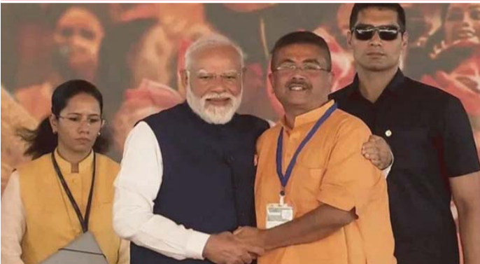
रवींद्रनाथ को दी श्रद्धाजलि

बंगाल में भाजपा की सरकार बनने के बाद शनिवार को कोलकाता के ऐतिहासिक पेरुड ग्राउंड में शपथ ग्रहण समारोह को आयोजन किया गया। सुबह 11 बजे सबसे पहले शुभेंद्रु अधिकारी ने मुख्यमंत्री पद की शपथ ली। शुभेंद्रु ने भवानीपुर से सीएम ममता बेनर्जी को 15 हजार से ज्यादा मतों से हराया। शुभेंद्रु ने अपनी पारंपरिक सीट नंदीग्राम से भी टीएमसी प्रत्याशी को हराया। शुभेंद्रु के बाद पांच विधायकों ने भी शपथ ली। इस दौरान पीएम मोदी, गृहमंत्री अमित शाह, एनडीए और भाजपा शासित राज्यों के 20 मुख्यमंत्री मौजूद रहे।