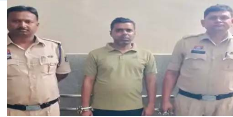
इन्वेस्टिगेटर पद पर नियुक्ति का झांसा देकर अलग-अलग किस्तों में 4 लाख 91 हजार रुपए ले लिए।