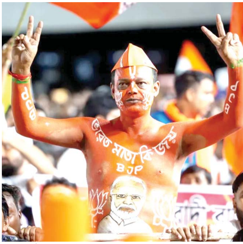
श्रीकंचनपथ न्यूज डेस्क

रायपुर। छत्तीसगढ़ में अगले 5 दिनों तक मौसम बदला हुआ रहेगा। मौसम विभाग ने प्रदेश के सभी संभागों में गरज-चमक, तेज हवा और हल्की बारिश की संभावना जताई है। कल यानी 5 मई को एक्टिविटी और तेज होने का अनुमान है। कुछ इलाकों में ओले भी गिर सकते हैं। पिछले 24 घंटों में उत्तर छत्तीसगढ़ के कई इलाकों में अधिकतम तापमान 2 से 5 डिग्री सेल्सियस तक बढ़ा। वहीं बाकी क्षेत्रों में तापमान में खास बदलाव नहीं हुआ। मौसम विभाग के मुताबिक आगले 24 घंटे तक तापमान में ज्यादा बदलाव नहीं होगा, लेकिन इसके बाद अगले 5 दिनों में अधिकतम तापमान 3 से 5 डिग्री तक गिर सकता है। प्रदेश में रविवार को सबसे ज्यादा अधिकतम तापमान 44 डिग्री सेल्सियस राजनांदगांव में रिकॉर्ड किया गया। वहीं सबसे कम न्यूनतम तापमान 21.3 डिग्री सेल्सियस जगदलपुर में दर्ज हुआ।