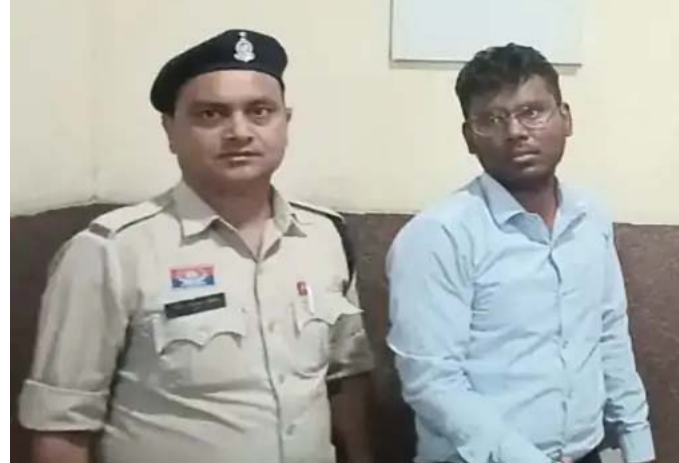
शादी का वादा कर संबंध बनाता रहा।

लेकिन आरोपी ने भरोसा दिलाया कि नौकरी लगने के बाद शादी करेगा। कोर्ट रिकॉर्ड के मुताबिक, फरवरी 2021 में आरोपी ने युवती को रायपुर के धरमपुरा स्थित अपने किराए के मकान में बुलाया। वहां शादी का भरोसा देकर उसके साथ जबरदस्ती शारीरिक संबंध बनाए। पीड़िता ने बयान में कहा कि, 2023-24 के दौरान भी आरोपी लगातार