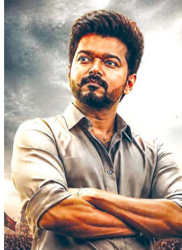
कौन हैं विजय जोसेफ

तमिलनाडु का नया 'नायक' : पहले ही चुनाव में विजय का 'मास्टर' स्ट्रोक