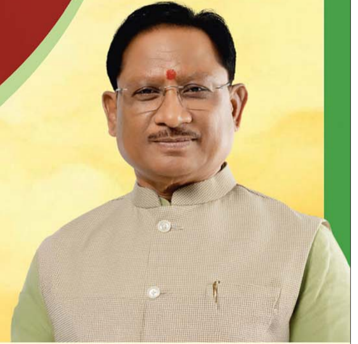
श्री विष्णु देव साय माननीय मुख्यमंत्री, छत्तीसगढ़

निराश्रित, घुमन्तू तथा जल्ल किए गए गौवंश का संरक्षण एवं संवर्धन