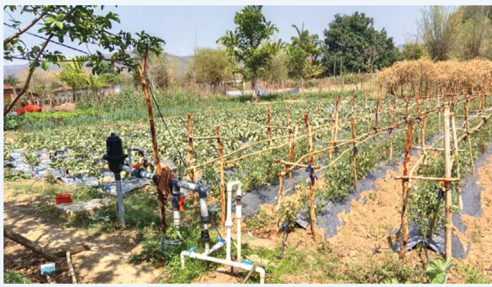
जिला पंचायत के मुख्य