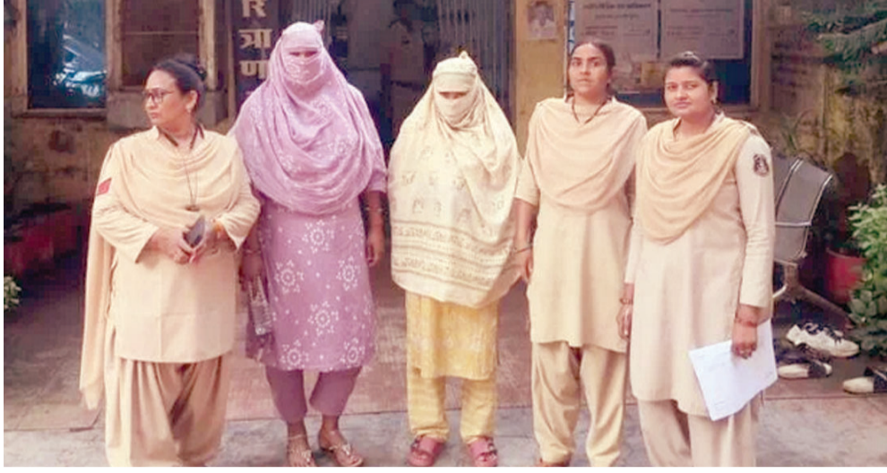
दरअसल इस मामले में प्रार्थिया शिकायत दर्ज कराई। नाबालिग ने मध्यप्रदेश की रहने वाली है। वह नाबालिग ने मोहन नगर थाने में बताया कि वह जिला अनुपपुर नवरात्रि में मंहर चुमने जाने के नाम पर

भिलाई। दुर्ग के मोहन नगर थाना क्षेत्र में अनुपपुर मध्यप्रदेश की रहने वाली एक नाबालिग को देह व्यापार में धकेलने का मामला सामने आया है। नाबालिग को बंधक बनाकर उसे देह व्यापार के लिए मजबूर किया गया। किसी तरह से नाबालिग वहां से निकली और थाने पहुंचकर शिकायत दर्ज कराई। इस मामले को गंभीरता से लेते हुए पुलिस ने दो महिला आरोपियों को गिरफ्तार किया है। आरोपी महिलाओं के खिलाफ मोहन नगर पुलिस ने धारा 137(2), 98, 64(2), 115(2), 3 (5) बीएनएस, 4, 6 पाक्सो एक्ट, 3, 4, 5, 7 अनैतिक व्यापार निवारण अधिनियम के तहत कार्रवाई की है।