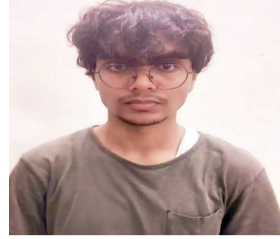
(IT Act) और साइबर शोषण के तहत गंभीर अपराध की श्रेणी में आता है।

पुलिस सूत्रों के अनुसार, आरोपी छात्र पिछले कई महीनों से AI-आधारित एडिटिंग टूल का उपयोग कर रहा था। उसने अपने सहपाठियों-विशेषकर छात्राओं की सोशल मीडिया प्रोफाइल तस्वीरों (Instagram, Facebook, LinkedIn) डाउनलोड कर ली थीं। इन तस्वीरों को उसने AI टूल की मदद से अश्लील स्वरूप में परिवर्तित किया और उन्हें अपने निजी डिवाइस तथा क्लाउड स्टोरेज पर सहेज रखा था। यह पूरा मामला सूचना प्रौद्योगिकी अधिनियम