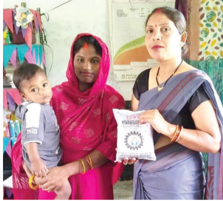
तत्काल गृहभेंट कर परिवार को उचित परामर्श दिया।