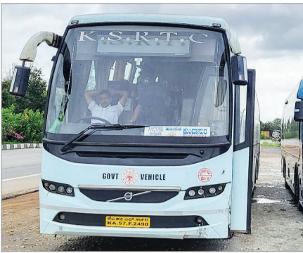
सुगम किफायती यातायात की सुविधा मिले।

मिली जानकारी के अनुसार रायपुर, दुर्ग, भिलाई, बिलासपुर तथा कोरबा को सड़कों पर ई बस चलाने की तैयारियां अंतिम चरण पर हैं। इसका उद्योग शहरीय क्षेत्रों को प्रदूषण मुक्त और स्मार्ट परिवहन सुविधा दिलाना है। प्रधानमंत्री नरेंद्र मोदी की पहल पर यह सौगात मिल रही है। अधिकारिक सूत्रों के अनुसार इस शहरीय परिवहन में क्रांति आएगी तथा परिवहन संरक्षण को लाभ मिलेगा। नगरीय प्रशासन के अधिकारियों के अनुसार अन्य शहरों को भी इस योजना में शामिल करने की तैयारी की जा रही है ताकि डीजल और पेट्रोल पर निर्भरता कम रहे तथा