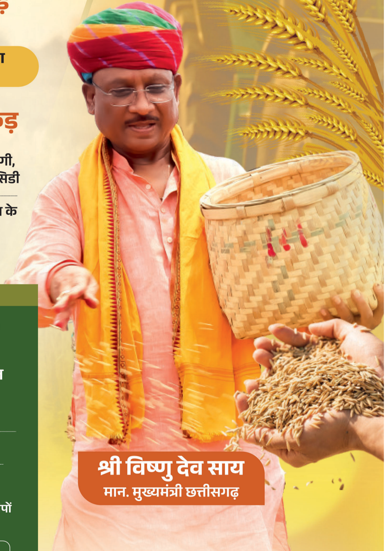
श्री विष्णु देव साय मान. मुख्यमंत्री छत्तीसगढ़

रेगहा, बटाई, लीज़, डुबान के किसानों को भी लाभ