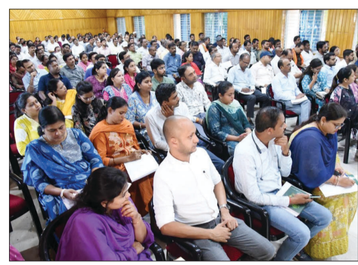
बताया कि जिले के कुल 123 खरीदी केंद्रों (नए व पुराने) में इस वर्ष खरीदी की जाएगी, जबकि 9 नवम्बर से टोकन कटना शुरू हो जाएगा। कलेक्टर ने निर्देश दिए कि 30 अक्टूबर तक सभी शेष किसानों का एग्रीस्ट्रेक पोर्टल पर पंजीयन पूर्ण कर खरीदी प्रक्रिया के पहले सभी तैयारियां पूरी करने के निर्देश दिए हैं। उन्होंने

दुर्ग। जिले में धान खरीदी की प्रक्रिया 15 नवम्बर से प्रारंभ होगी। जिला कलेक्टर अभिजीत सिंह के निर्देश पर इसकी तैयारियां शुरू कर दी गई हैं। प्रक्रिया के सुचारु संचालन के लिए प्रशिक्षण शिविरों का आयोजन किया गया। दुर्ग, धमधा, पाटन एवं भिलाई-3 चरोदा के सभी अनुविभागों में प्रशिक्षण कार्यक्रम आयोजित किया गया। इसमें अनुविभागीय अधिकारी (राजस्व), तहसीलदार, नायब तहसीलदार, राजस्व निरीक्षक, पटवारी, नोडल अधिकारी, धान उपार्जन केंद्र, सहकारी समितियों के अध्यक्ष/प्राधिकृत अधिकारी, समिति प्रबंधक, सेवा सहकारी समिति के प्रतिनिधि एवं कंप्यूटर ऑपरेटरों को तीन पार्लियों में बी.आई.टी. कॉलेज दुर्ग में प्रशिक्षण दिया गया।