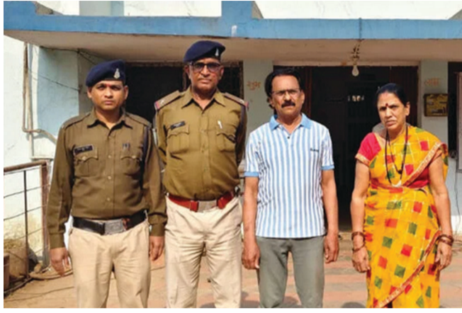
लगाते पर बाउंस हो गया। इसके बाद सभी रुपए देने के नाम पर आनाकानी करते रहे।