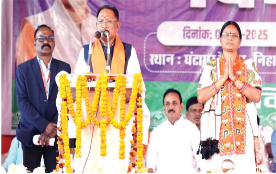
कांग्रेस सरकार में छत्तीसगढ़ में हर तरफ भ्रष्टाचार