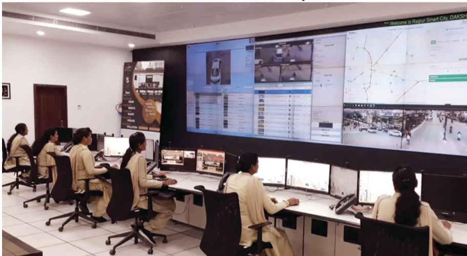
अंदर ई-चालान भेजा जाएगा।

ट्रेफिक पुलिस के मुताबिक, ट्रेफिक नियमों की अनदेखी करने वालों को पांच मिनट में ई-चालान मिले, इसके लिए प्रयोग के तौर पर शुरुआत में सौ वाहन चालकों को ई-चालान जनरेट कर भेजा जाएगा। प्रयोग सफल होने पर ई-चालान भेजने की संख्या बढ़ाई जाएगी। इसके बाद ट्रेफिक निगम तोड़ वाहन चलाने वाले सभी वाहन चालकों को पांच मिनट के