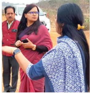
का निरीक्षण करते निर्देश दी है कि भिलाई इस्पात संयंत्र के, रिसाली निगम के कार्यालय अभियंता, सिंचाई विभाग व पी.एच.ई. विभाग के अधिकारी संयुक्त रूप से

रिसाली। रिसाली के नागरिकों को पेयजल उपलब्ध कराने बनी योजना का अब सर्वे होगा। सर्वे करने 5 विभाग के अधिकारियों की टीम बनेगी। कलेक्टर ऋचा प्रकाश चौधरी ने टीम तीन दिवस के भीतर बनाने निर्देश दिए हैं। गुरुवार शाम कलेक्टर ऋचा प्रकाश चौधरी सीधे मरोदा डेम पहुंची। उन्होंने मरोदा डेम के ओवरफ्लो लाइन पर हुए अतिक्रमण समेत रिसाली के नागरिकों को पेयजल उपलब्ध कराने बनी योजना की जानकारी दी। उन्होंने संयंत्र के मरोदा डेम