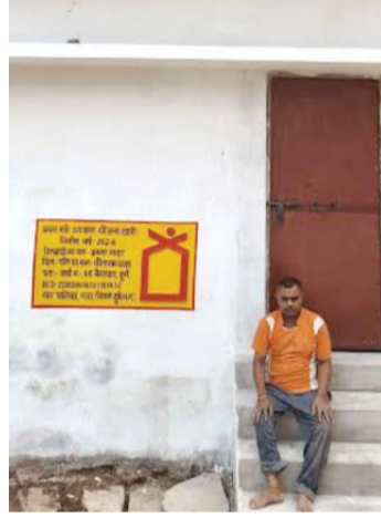
तंगी, परिवार की जिम्मेदारी, भाई की मजदूरी ऊपर से कच्चा मकान बारिश की

गरीबी और शरीर की लाचारी से तंग आकर मैं हिम्मत हार चुका था, मेरा एक पैर पूरी तरह से शून्य है। ऐसी तंगी हालत में कच्चे मकान में रहना बहुत ही दुखद प्रतीत होता था, शरीर की लाचारी, पैसे की