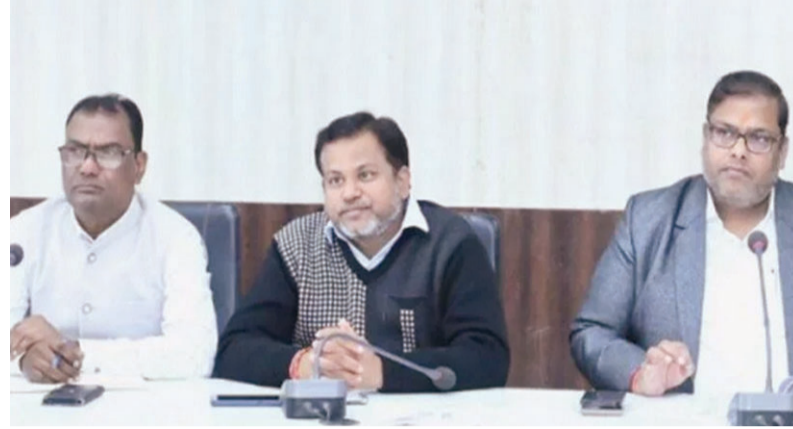
कलेक्टर के निर्देश पर फिंगेश्वर के बीईओ और बीआरसीसी को मॉनिटरिंग में लापरवाही के लिए कारण बताओ नोटिस जारी किया गया। कलेक्टर ने स्पष्ट किया कि बोर्ड परीक्षा

रायपुर। गरियाबंद जिले के हाई स्कूल और हायर सेकेंडरी स्कूलों के अर्द्धवार्षिक परीक्षा परिणामों की समीक्षा करते हुए कलेक्टर दीपक अग्रवाल ने कड़ी कार्रवाई की है। जिला पंचायत सभागार में आयोजित समीक्षा बैठक में परीक्षा परिणामों की समीक्षा की गई। इस दौरान खराब प्रदर्शन वाले स्कूलों के प्रति नाराजगी जाहिर करते हुए कलेक्टर ने टीडी हायर सेकेंडरी स्कूल फिंगेश्वर के प्राचार्यों को तत्काल हटाने और 36 स्कूलों के प्राचार्यों को कारण बताओ नोटिस जारी करने के निर्देश दिए।