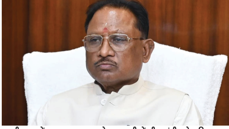
छत्तीसगढ़ में अब तक 11 लाख से अधिक लोगों की स्क्रीनिंग

रायपुर। छत्तीसगढ़ में टीबी मुक्त भारत अभियान का संचालन सभी जिलों में पूरी मुस्तैदी के साथ किया जा रहा है। छत्तीसगढ़ के स्वास्थ्य विभाग द्वारा लोगों को टीबी के प्रति न सिर्फ जागरूक किया जा रहा है बल्कि उन्हें सरकार द्वारा चलाए जा रहे अभियान की जानकारी भी दी जा रही है। शहरी व ग्रामीण क्षेत्र में स्वास्थ्य विभाग द्वारा लगातार काम किया जा रहा है। छत्तीसगढ़ के मुख्यमंत्री विष्णुदेव साय ने शनिवार को केन्द्रीय मंत्री जेपी नड्डा को प्रदेश में चलाए जा रहे टीबी मुक्त अभियान की संपूर्ण जानकारी दी।