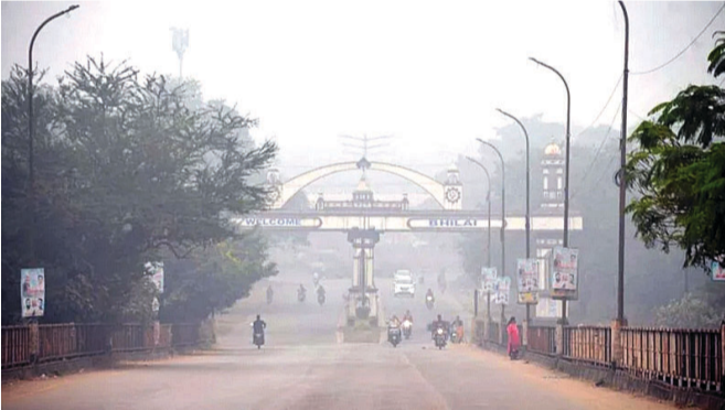
रहा। वहीं दिन में टेंपरेचर 30.2 डिग्री कम रहा। तब पहुंचा था। यानी रात में पूरे 16.4 डिग्री ठंडीसगढ़ के सभी हिस्सों में ठंड

भिलाई। छत्तीसगढ़ में अब शरद ऋतु का असर दिखने लगा है। कार्तिक पूर्णिमा के बाद से ही रात और अधिक ठंडी होने लगी है। छत्तीसगढ़ के प्रमुख शहरों में दिन की तुलना में रात का तापमान आधे रह गया है। कुछ शहरों में तो दिन की अपेक्षा रात का तापमान आधे से भी कम हो गया है। दुर्ग भिलाई इनमें से एक हैं जहां दिन और रात के तापमान में भारी अंतर देखने को मिल रहा है। दुर्ग भिलाई में रविवार रात को न्यूनतम तापमान 13.8 डिग्री