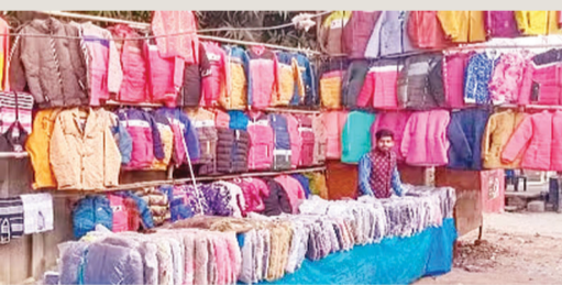
मार्केट में महिलाओं के लिए बहुत कुछ नया आया है। ये गर्म कपड़े पहनने से गर्मी तो मिलेगी, साथ ही महिलाओं की सुंदरता पर भी चार-चांद लगेगा। क्योंकि इस बार महिलाओं की पसंद का विशेष ध्यान रखा गया है। इसे महिलाएं साड़ी के

ब्रांडेड कंपनियों के साथ तिब्बती उलन बाजार में भी लेटेस्ट फैशन को ध्यान में रखकर गर्म कपड़े उपलब्ध हैं। खासतौर से इस बार के उलन