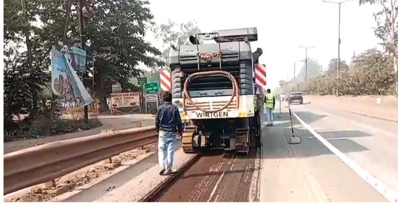
27 किमी फेरलेन सड़क पर बनने के बाद से अब तक प्रारंभ में टैनेस नहीं किया गया। जब भी कहीं शिकायत होती वहां व पंच वर्क कर दिया जाता। इससे ज्यादा कहीं भी काम नहीं हुआ।

नेहरू नगर से रायपुर के टाटीबंध तक सड़क पर जगह जगह गड्डे हैं और सड़क कई जगहों पर असमतल व जर्जर भी हो गई। इसके मटेनेंस को लेकर बार बार मांग उठती रही। अब जाकर कहीं इसकी शुरुआत की गई है।