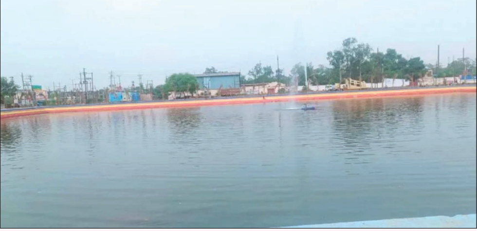
51 पवित्र नदियों का जल सूर्य कुंड में होगा समाहित