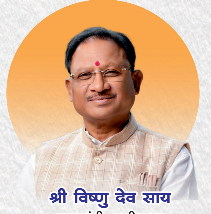
श्री विष्णु देव साय मुख्यमंत्री, छत्तीसगढ़