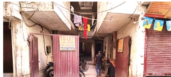
घटना स्थल : जहां पिता ने चार बेटियों के साथ की खुदकुशी

नईदिल्ली (एजेंसी)। एक साथ पांच लोगों की खुदकुशी ने राजधानी को दहला दिया। यह घटना शुक्रवार को सामने आई। देश की राजधानी दिल्ली में एक ही परिवार के पांच लोगों ने खुदकुशी कर ली। वसंत कुंज के रामपुरी गांव में रहने वाले पिता व उसकी चार बेटियों ने एक साथ खुदकुशी कर ली। सूचना मिलते ही मौके पर पहुंची पुलिस ने जांच शुरु कर दी है। बताया जा रहा है कि पांचों ने जहरीला पदार्थ खाकर जान दी है। पड़ोसियों और मकान मालिक से सूचना मिलने के बाद पुलिस ने फ्लैट का ताला तोड़कर शवों को बाहर निकाला है।