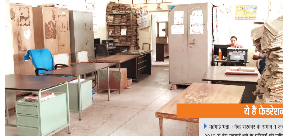
ये हैं फेडरेशन की 4 मांगें

अधिकारी-कर्मचारी फेडरेशन ने प्रदेश की सरकार से चुनाव पूर्व किए गए वायदे को पूरा करने की मांग की है। फेडरेशन के पदाधिकारियों ने कहा कि भाजपा ने सत्ता में आने से पहले ही अधिकारियों-कर्मचारियों की मांगों को पूरा करने का आश्वासन दिया था, जिसे मोदी की गारंटी का नाम दिया गया। प्रदेश में भाजपा की सरकार बने काफी वक़्त हो गया है और सरकार ने भी मोदी की ज्यादातर गारंटियों को पूरा कर दिया है, लेकिन शासकीय कर्मियों की मांगों अब भी पूरी नहीं की गई है। फेडरेशन के लोगों का कहना था कि प्रदेश की भाजपा सरकार ने छत्तीसगढ़वासियों के बीच अपनी एक अलग छवि बनाई है और लोग इस सरकार को जनता के प्रति ज्यादा से ज्यादा जवाबदेह भी मान रहे हैं। ऐसे में सरकार को भी अधिकारी-कर्मचारियों की मांगों को गम्भीरता से लेकर उन्हें पूरा करना चाहिए।