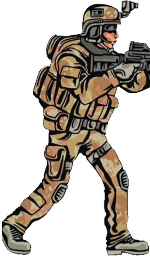
श्रीकंचनपथ न्यूज डेस्क

पड़े हैं। लगातार हो रही मुठभेड़ों से नक्सलियों को अत्यधिक नुकसान उठाना पड़ा है। सरकार की सरेंडर पॉलिसी भी नक्सलियों को आकर्षित कर रही है। यही वजह है कि अब जनताना सरकार करीब-करीब खत्म होने को है। ऐसे क्षेत्रों में अब फोर्स पूरी तरह से हावी है। पिछले कुछ महीनों में नक्सल प्रभावित क्षेत्रों में सुरक्षा बलों ने नए कैम्प खोले हैं। इन कैम्पों के आसपास के 5 किमी की परिधि में सड़क, पानी, बिजली, स्कूल और शासकीय योजनाओं का लाभ दिलाने जैसे काम करवाए जा रहे हैं। इसका नतीजा है कि आदिवासियों का सरकार के प्रति भरोसा बढ़ा है।