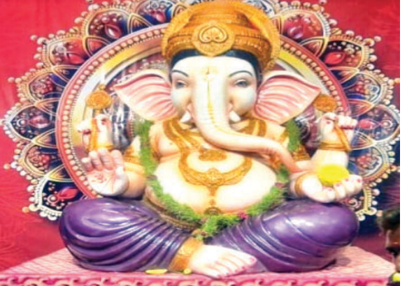
थनौद से 15 फीट ऊंची प्रतिमा को

दुर्ग। महाराजा चौक में आदियोगी कोयम्बटूर तमिलनाडु की तर्ज पर बना गणेश पंडाल इन दिनों आकर्षण केन्द्र है। 50 फीट उंचा पंडाल हर व्यक्ति का ध्यान अपनी तरफ आकर्षित कर रहा है।