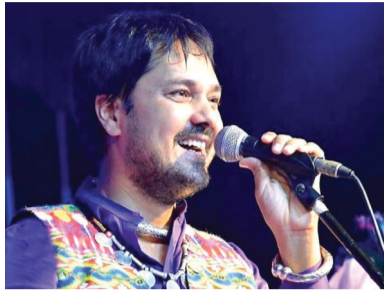
समारोह के मंच को सुशोभित करेंगी।

बनाया। उन्होंने कई महत्वपूर्ण नृत्य प्रस्तुतियां की हैं, जिनमें भारतीय पौराणिक कथाओं और धार्मिक कथाओं का सुंदर चित्रण होता है। उनके प्रदर्शन में नृत्य की विभिन्न मुद्राओं और भावनाओं का अभिव्यक्ति, दर्शकों को मंत्रमुग्ध कर देती है। उनकी नृत्य साधना और कला के प्रति समर्पण ने उन्हें न केवल सिनेमा की दुनिया में, बल्कि शास्त्रीय नृत्य की दुनिया में भी एक महत्वपूर्ण स्थान दिलाया है। उन्हें वर्ष 2000 में चौथे सर्वोच्च नागरिक सम्मान पद्मश्री से सम्मानित किया गया है।