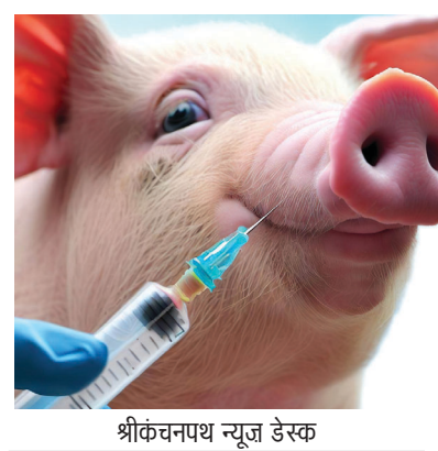
श्रीकंचनपथ न्यूज डेस्क

कोरोना के बाद कहर ढाने लगा स्वाइन फ्लू, लगातार बढ़ रहे पीड़ितों के आंकड़े, पखवाड़ेभर में आधा दर्जन मौतें