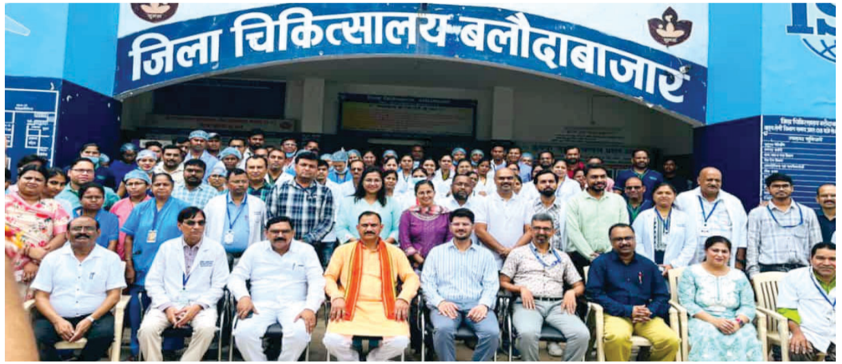
संस्था को उक्त प्रमाण पत्र मिलना बेहतर होती सुविधा को प्रकट करता है। जिला अस्पताल में इस एनक्यूएस के अंतर्गत परीक्षण के लिए 15 विभागों जैसे- आईपीडी ओपीडी, आपातकाल, मेटरनिटी, लेबर, फार्मसी, ब्लड बैंक, रेडियोलॉजी, लैब,

ओटी, एसएनसीयू आदि के 8 क्षेत्रों की जांच की गई। इनमें सर्विस व्यवस्था मरीज के अधिकार, इनपुट, सपोर्ट सर्विस, क्लीनिकल सर्विस संक्रमण नियंत्रण तथा आउटकम जैसे क्षेत्र शामिल हैं। बलौदाबाजार-भाटापारा जिला अस्पताल को एनक्यूएस के साथ-साथ लक्ष्य प्राप्ति का भी प्रमाण पत्र हासिल हुआ है जो माता और शिशु स्वास्थ्य हेतु निर्धारित है। सीएमएचओ के अनुसार निरीक्षण के लिए आई टीम ने अस्पताल के कुछ विभाग जैसे विशेष नवजात देखभाल इकाई (एसएनसीयू), पोषण पुनर्वास केंद्र (एनआरसी) एवं आपातकालीन को सबसे अधिक सराहा है। गौरतलब है की जिला अस्पताल को इससे पूर्व भी इस हेतु यह प्रमाण पत्र मिल चुका है। नया प्रमाण पत्र यह प्रकट करता है कि यहां गुणवत्तापूर्ण सेवाओं में निरंतरता जारी है, जो कि यहां के चिकित्सकीय स्टाफ द्वारा की संभव हो पाया है।