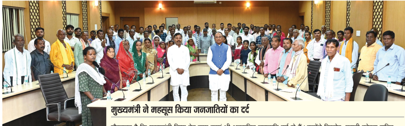
मुख्यमंत्री ने महसूस किया जनजातियों का दर्द