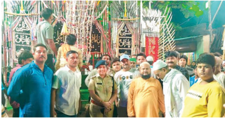
पढ़ी गई दुआए आशूरा