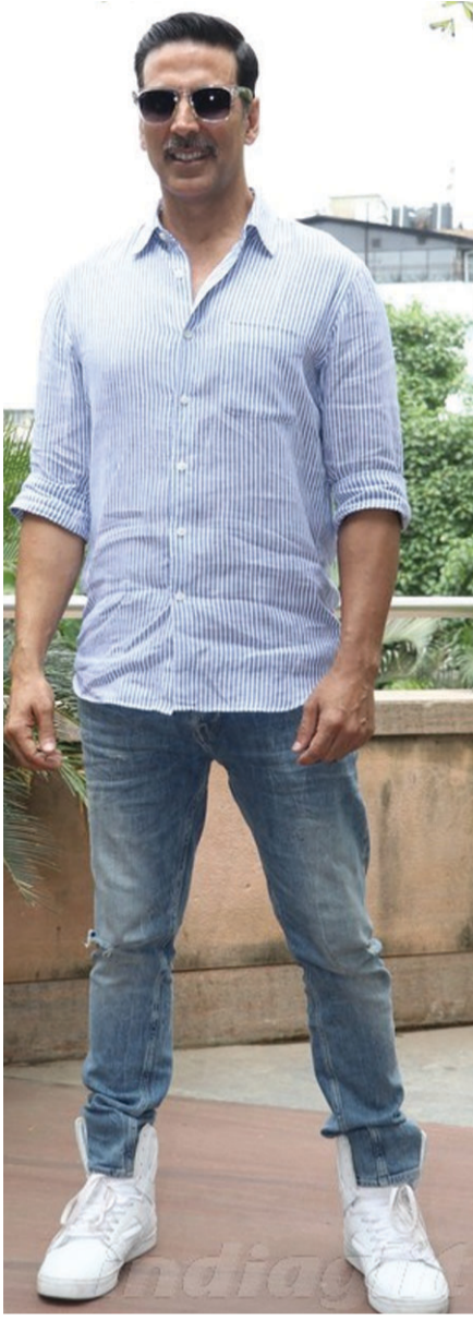
साल 12 जुलाई को थिएटर्स में रिलीज होगी।

सरफिरा, तमिल फिल्म सोरारई पोटरु की हिंदी रीमेक है। ओरिजिनल फिल्म में सुर्या ने लीड रोल निभाया था। सोरारई पोटरु ने अपनी कहानी के लिए नेशनल अवॉर्ड भी जीता था। वहीं, अब इसका हिंदी एडिशन आ रहा है, जिसका डायरेक्शन सुधा कोंगार ने किया है। फिल्म में अक्षय कुमार और राधिका मदान के साथ परेश रावल और सीमा बिस्वास ने भी अहम किरदार निभाए हैं। फिल्म इस