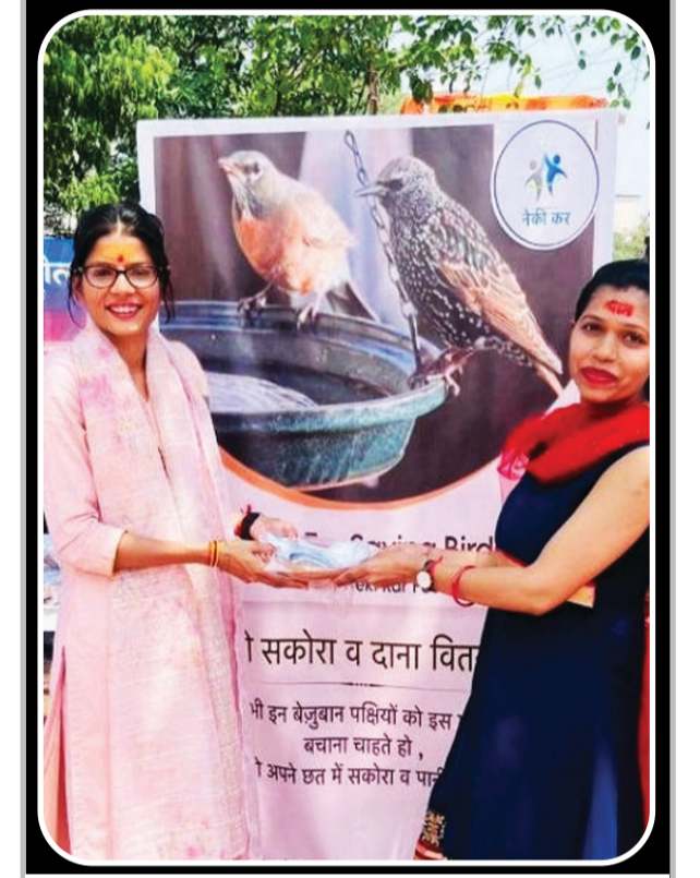
रायपुर। पशु-पक्षियों की सेवा में कार्यरत संस्था नेकी कर फाउंडेशन ने रामनवमी पर राम मंदिर के प्रांगण में पक्षियों के लिए सकोरा व दाना का वितरण किया। इस दौरान संस्था ने रायपुरवासियों को पक्षियों की सेवा के लिए प्रेरित किया। नेकी कर संस्था ने 2000 सकोरे व 3500 पैकेट दाना का वितरण किया। इस कार्य में 30 वोलंटियर्स ने सेवा दी। यदि आप भी पक्षियों की मदद करना चाहते हैं तो संस्था के ऑफिस से सकोरा प्राप्त कर सकते हैं।