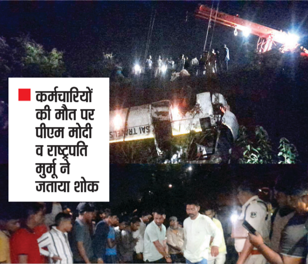
कर्मचारियों की मौत पर पीएम मोदी व राष्ट्रपति मुर्मू ने जताया शोक

हादसे में 15 कर्मी घायल, केडिया डिस्टलरी ने मृतकों के परिजनों को 10-10 लाख के मुआवजे का किया ऐलान