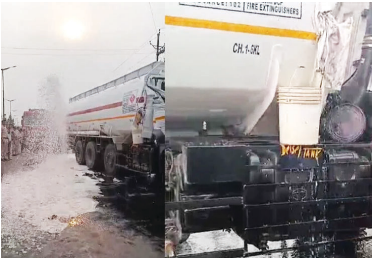
टैंकर सामने की ओर जा रहे टुक से भिड़ गया। हादसे के बाद टैंकर का चालक वाला हिस्सा बुरी तरह क्षतिग्रस्त हो गया। इसके

यह हादसा मंगलवार दोपहर चार से पांच बजे के बीच हुआ है। सुपेला थाने के सामने फ्लाईओवर के मुहाने पर केरोसीन से भरा