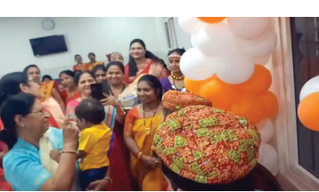
नाले में या मातृछाया के ही पालने में संस्था को मिल जाते हैं। यह संस्था भारत सरकार और स्थानीय महिला एवं बाल विकास विभाग से पंजीकृत होती है। यहाँ पल रहे एक वर्ष 11 महीने के बालक को अमेरिकन दंपति ने गोद लिया है। बीते कई सालों से किसी बच्चे को गोद लेने की प्रक्रिया का पालन कर रहे थे। लंबे इंतजार के बाद उन्हें अवसर मिला। भारतीयों की संस्कृति को देखकर वह अभिभूत थे। उन्होंने कहा कि हमें भारतीय संस्कृति से बेहद लगाव है,

मातृछाया सेवा भारती प्रकल्प में ऐसे बच्चों को रखा जाता है, जिन्हें पैदा होते ही उनके माता-पिता त्याग देते हैं। जो कूड़े में,