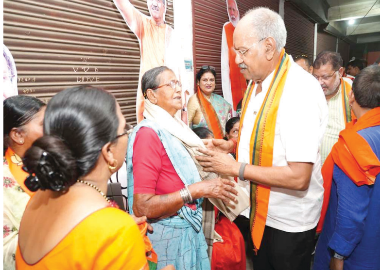
कमल खिलेगा और आज देश भर में कमल खिल चुका है। अयोध्या में राम मंदिर निर्माण के साथ ही सनातन का सूर्योदय हो गया है। यह भाजपा कार्यकर्ताओं के समर्पण, सेवा और संघर्ष का ही परिणाम है कि मोदी जी के नेतृत्व में देश लगातार प्रगति कर रहा है और 2047 तक विकासशील से विकसित देश बन जाएगा।