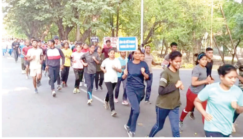
गया। कलेक्टर के निर्देश पर जिला पंचायत के मुख्य कार्यपालन अधिकारी एवं स्वीप के

भिलाई रन फॉर वोट मैराथन मंगलवार की सुबह सेक्टर-9 हॉस्पिटल चौक से शुरू हुआ। सेंट्रल एवेन्यू के रास्ते विभिन्न सेक्टर से होते हुए ग्लोब चौक से वापस होते हुए सेक्टर-9 हॉस्पिटल चौक पर इसका समापन किया