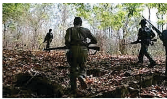
पुलिस द्वारा सर्चिंग अभियान जारी है। पुलिस अभी घटनास्थल से वापस नहीं लौटी है। बीजापुर

श्रीकंचनपथ न्यूज बीजापुर। छत्तीसगढ़ के बीजापुर जिले के नक्सल प्रभावित बासागुड़ा थाना क्षेत्र के पोलमपल्ली क्षेत्र में पुलिस और नक्सलियों के बीच जबरदस्त मुठभेड़ में 6 नक्सलियों के मारे जाने की खबर है। पुलिस की ओर से सघन सर्चिंग अभियान जारी है। मुठभेड़ सुबह लगभग 7-8 बजे के बीच हुई। बासागुड़ा से सीआरपीएफ, डीआरजी और कोबरा बटालियन के द्वारा नक्सलियों के पोलमपल्ली क्षेत्र में आमद के सूचना पर पुलिस बल रवाना हुआ था। जानकारी के अनुसार पुलिस को देख नक्सलियों ने फायरिंग शुरू कर दी। जवाबी कार्रवाई में सुरक्षा बलों द्वारा ताबड़तोड़ फायरिंग की गई। जानकारी के अनुसार मुठभेड़ खत्म होने के बाद क्षेत्र की सर्चिंग करने पर छह नक्सलियों के शव बरामद हुए हैं। घटनास्थल व इसके आसपास