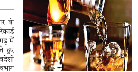
पहले, यानी होलिका दहन के दिन प्रदेश के लोगों ने 20 करोड़ की शराब खरीदी।

रायपुर। छत्तीसगढ़ में होली के त्योहार के दौरान शराब प्रेमियों ने एक बार फिर रिकार्ड बनाया है। होली के अवसर पर छत्तीसगढ़ में मंदिरा प्रेमियों ने जमकर जाम छलकाते हुए तीन दिनों में करोड़ों रुपए की देशी-विदेशी शराब की पी है। छत्तीसगढ़ आबकारी विभाग के आंकड़ों के मुताबिक, होलिका दहन के दिन एक ही दिन में सबसे ज्यादा शराब की बिक्री हुई है। होली के उत्सव में जहां एक तरफ लोग रंग और गुलाल से जश्न मना रहे थे तो वहीं दूसरी तरफ एक वर्ग ऐसा भी है जिसने रंग गुलाल के साथ-साथ जमकर शराब उड़ते हुए होली का त्योहार मनाया। यही वजह है कि छत्तीसगढ़ एक बार फिर होली के त्योहार के वक्त शराब की बिक्री में एक नया कीर्तिमान स्थापित कर दिया है। सिर्फ होली के दौरान महज तीन दिनों के भीतर प्रदेश में लोगों के द्वारा 43 करोड़ रुपए की देशी और विदेशी शराब खरीदी गई है। सिर्फ तीन दिन के भीतर छत्तीसगढ़ के लोगों ने 43 करोड़ रुपए की शराब पीकर खत्म कर दी है। इसमें हौरान करने वाली बात यह भी है इन तीन दिनों में जिस दिन सबसे ज्यादा शराब खरीदी गई है वह होली के त्योहार के ठीक 1 दिन