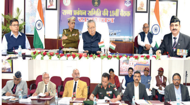
तरीकों पर ध्यान देना चाहिए ताकि पूर्व सैनिकों और महिलाओं के कल्याण के लिए और अधिक योजनाएं शुरू की जा सकें।