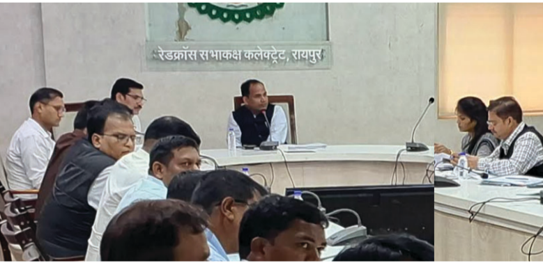
जानकारी ली। उन्होने कहा कि वाले अविवाहित नामांतरण, बंटवारा तथा सीमांकन के प्रकरणों को जल्द से जल्द एवं गुणवत्तापूर्ण निराकरण करें। सभी एसडीएम अपने