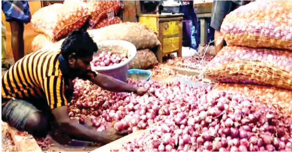
आधी हुई प्याज की आवक

बोते सप्ताह तक रोजाना प्याज की 30 से 35 गाड़ियां