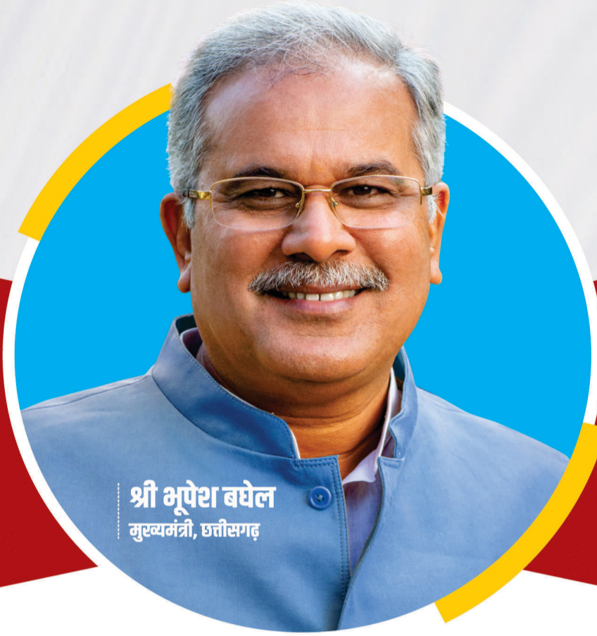
श्री भूपेश बघेल मुख्यमंत्री, छत्तीसगढ़