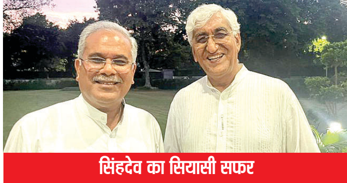
सिंहदेव का सियासी सफर

आपकी जानकारी के लिए बता दें कि प्रदेश में इसी साल के अंत में विधानसभा चुनाव होने हैं। 2018 में हुए विधानसभा के चुनावों में कांग्रेस ने विधानसभा की 90 में से 68 सीटों पर जीत हासिल की थी। वहीं 15 साल तक सत्ता में काबिज रही बीजेपी 15 सीटों पर ही सिमट गई थी। जीत के बाद कांग्रेस ने भूपेश बघेल को मुख्यमंत्री बनाया था। सीएम बघेल के कुर्सी पर काबिज होते ही कई बार भूपेश बघेल और टीएस सिंहदेव के बीच