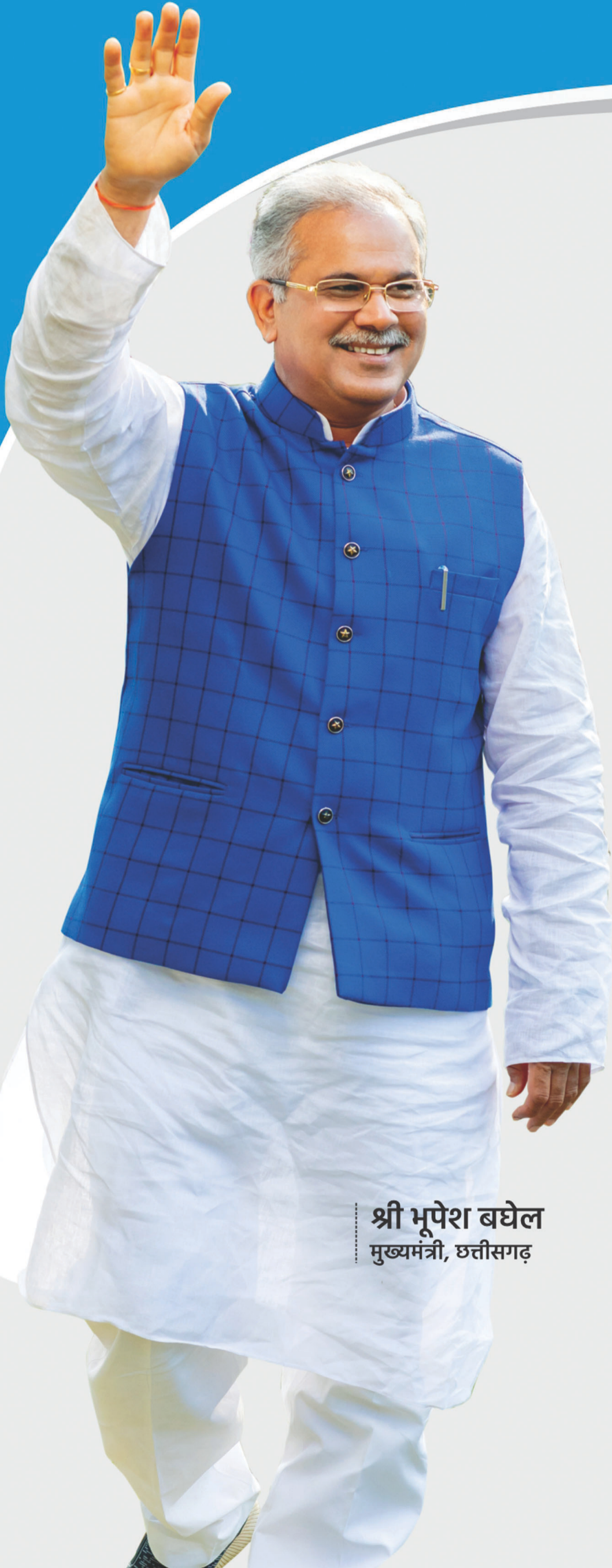
श्री भूपेश बघेल मुख्यमंत्री, छत्तीसगढ़