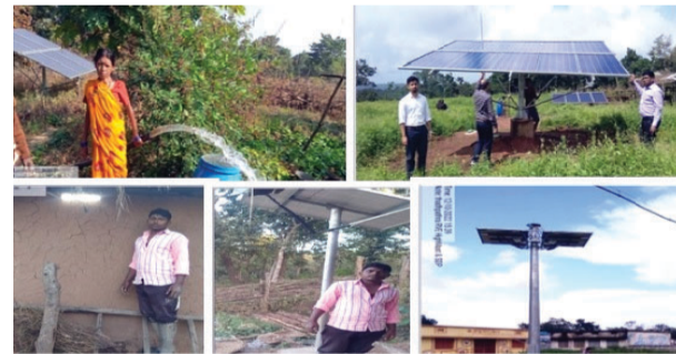
गांव ढाढपथरा में 247 हितग्राही परिवारों के घरों में विद्युतीकरण हेतु कुल 88 किलोवॉट के 10 संयंत्र स्थापित किये गये हैं। सोभाग योजनांतर्गत सोलर होम लाइट की स्थापना की गई है। प्रत्येक परिवारों को 200

गौरैला-पेंड्रा-मरवाही। जिले के ग्राम ढाढपथरा वनों से घिरा और पहाड़ी मैदान पर बसे आदिवासी बाहुल्य गांव है, जहां परम्परागत ऊर्जा से विद्युतीकरण किया जाना संभव नहीं था। गांव के घरों और गलियों में प्रकाश व्यवस्था के साथ ही पीने के लिए और सिंचाई के लिए पानी की आवश्यकता थी। इस कमी को पूरा करने के लिए छत्तीसगढ़ राज्य अक्षय ऊर्जा विकास अभिकरण (क्रेडा) ने इसे चुनौती के रूप में स्वीकार किया और सम्पूर्ण ग्राम ढाढपथरा के घरों को गैर परम्परागत ऊर्जा (सौर संयंत्र) से विद्युतीकृत किया है।