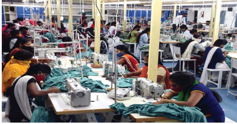
यहां तैयार किए गए रेडीमेड गारमेंट निर्यात किए जा रहे हैं। महिलाओं द्वारा तैयार किए गए इन कपड़ों से कंपनी को अब तक करीब 72 करोड़ रुपए की आमदनी हुई है। इस फैक्ट्री के

डेनेक्स फैक्ट्री से अब तक 12 लाख गारमेंट बनाकर विक्रय के लिए भेजे जा चुके हैं। यहां तैयार किए गए रेडीमेड कपड़ों की गुणवत्ता और उनकी डिजाइन ग्राहकों को लुभा रही है। इसी का नतीजा है कि कई बड़े मल्टीनेशनल स्टोर्स और ऑनलाइन शॉपिंग प्लेटफॉर्म पर भी इन कपड़ों की बड़ी डिमांड है। देश के विभिन्न राज्यों के साथ-साथ कई अन्य देशों को भी