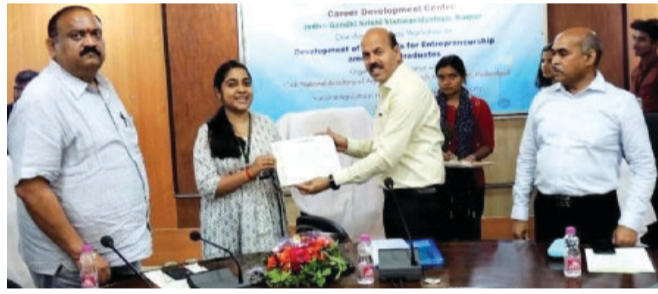
संचालित कैरियर डेव्लपमेंट सेन्टर द्वारा भारतीय कृषि अनुसंधान परिषद, राष्ट्रीय कृषि उच्च शिक्षा परियोजना (छ।भू.क), भारतीय कृषि प्रबंधन अकादमी (छ।।।।), के सहयोग से 'कृषि छात्रों में उद्यमशीलता हेतु कौशल विकास' विषय पर आयोजित एक दिवसीय कार्यशाला का समापन कर रहे थे। इस कार्यशाला का मुख्य उद्देश्य कृषि छात्रों में कौशल विकास, नवाचार एवं उद्यमशीलता का विकास है। कार्यशाला में कृषि, कृषि

उन्होंने कहा कि कृषि तथा प्रौद्योगिकी के क्षेत्र में मित हो रहे नवीन अनुसंधानों तथा तकनीकों से इन क्षेत्रों में नवाचार तथा स्टार्टअप प्रारंभ करने हेतु बेहतर वातावरण तैयार हुआ है, जिसका विद्यार्थियों को लाभ उठाना के लिए आगे आना चाहिए। डॉ. चंदेल विश्वविद्यालय में