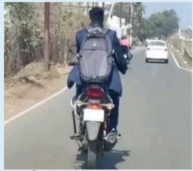
हाथ पैर छोड़कर बाइक चला रहा था स्कूली छात्र, वीडियो वायरल और चालान लेकर घर पहुंची पुलिस

भिलाई। बाइक पर स्टैंट करने वालों पर दुर्ग पुलिस लगातार कार्रवाई कर रही है। ताजा मामले में स्कूली छात्र पर कार्रवाई की गई। दरअसल छात्र स्कूली ड्रेस में बाइक पर सवार होकर स्टैंट बाजी कर रहा था। अपना एक पैर बाइक की लेग गार्ड पर रखा और हंडल भी एक हाथ से पकड़ा हुआ था। रास्ते में चलते किसी ने छात्र की स्टैंटबाजी का वीडियो पुलिस के वाट्सएप नंबर पर भेज दिया और इसके बाद शुरू हुआ यातायात विभाग का काम।