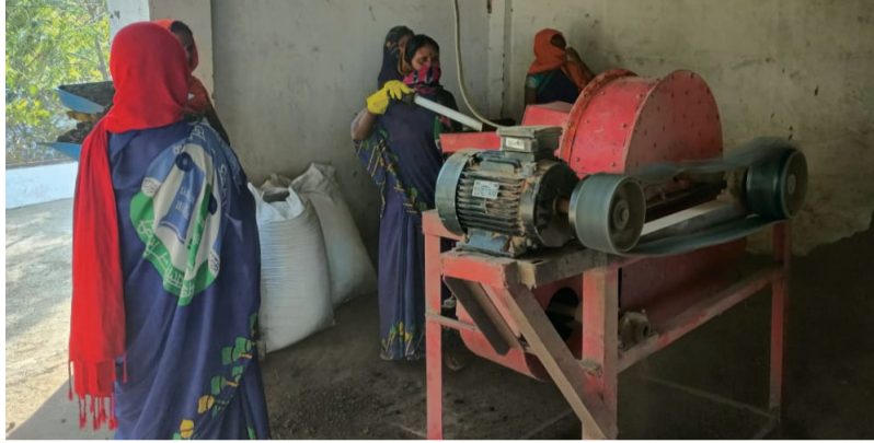
लाख 31 हजार 700 रुपए की आय प्राप्त हुई है। इस आय से स्व-सहायता समूह को 9 लाख 58 हजार 200 रुपए का मुनाफा हुआ है। मुख्यमंत्री भूपेश बघेल की महत्वाकांक्षी नरवा,

ऐसी ही एक कहानी है छत्तीसगढ़ के उत्तरी छोर में बसे बलरामपुर-रामानुजगंज जिले की। यहां की प्रगति महिला स्व-सहायता समूह की महिला सदस्यों ने विगत तीन वर्षों में गोबर से वर्मी कम्पोस्ट, घरों से निकलने वाले कचरे से खाद बनाकर एवं सामुदायिक बाड़ी विकास के कार्यों से करीब 37 लाख 17 हजार रुपए कमाये हैं। प्रगति स्व सहायता महिला समूह की 28 महिलाओं द्वारा अब तक 3 हजार 724 क्विंटल वर्मी कम्पोस्ट खाद का उत्पादन किया गया है, जिसमें से 3 हजार 631 क्विंटल वर्मी खाद का विक्रय किया गया है, जिससे कुल 36