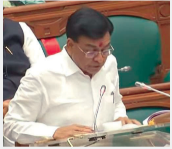
मध्यप्रदेश का बजट