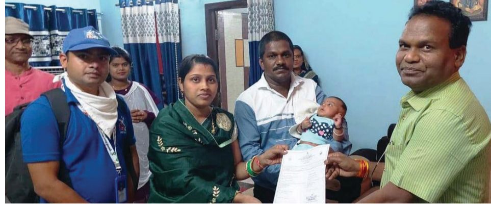
मितान योजना में 13 प्रकार की सेवाएं दी जा रही हैं। भविष्य में इन सेवाओं को और बढ़ाने की योजना है। वर्तमान में जन्म प्रमाण पत्र, जन्म प्रमाण पत्र में सुधार, मृत्यु प्रमाण पत्र, मुख्यमंत्री मितान योजना से लाभान्वित होने के

मुख्यमंत्री भूपेश बघेल की पहल पर नगरीय प्रशासन विकास विभाग द्वारा 01 मई 2022 से प्रदेश के समस्त 14 नगर निगमों में शुरू की गई मुख्यमंत्री मितान योजना में अब तक लगभग 62 हजार लोगों ने शासकीय दस्तावेज घर पर प्राप्त करने के लिए अप्वाइंटमेंट बुक कराया है, वहीं दूसरी तरफ 51 हजार से अधिक नागरिकों ने घर बैठे ही अपने जरूरी शासकीय दस्तावेज प्राप्त किए हैं। इस योजना में लगभग 01 लाख 25 हजार से अधिक नागरिकों ने मितान योजना के टोल फ्री नंबर 14545 पर सम्पर्क कर शासकीय दस्तावेजों को प्राप्त करने के संबंध में जानकारी हासिल की है।