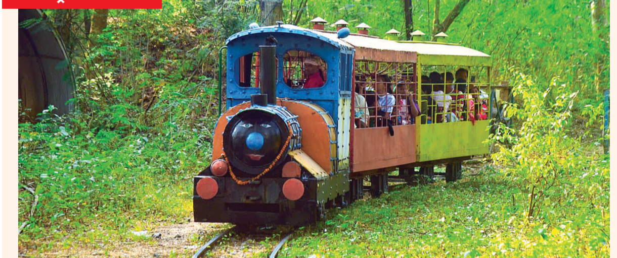
भिलाई। मैत्री बाग में फ्लावर शो को लेकर तैयारी तेज हो गई है। हजारों की संख्या में पर्यटक पहुंच रहे हैं। वहीं आगंतुकों के लिए गार्डन प्रबंधन के द्वारा मिनी ट्रेन चालू किया गया है। जिसमें बैठकर पर्यटक गार्डन की सैर-सपाटे कर आनंद ले रहे हैं।