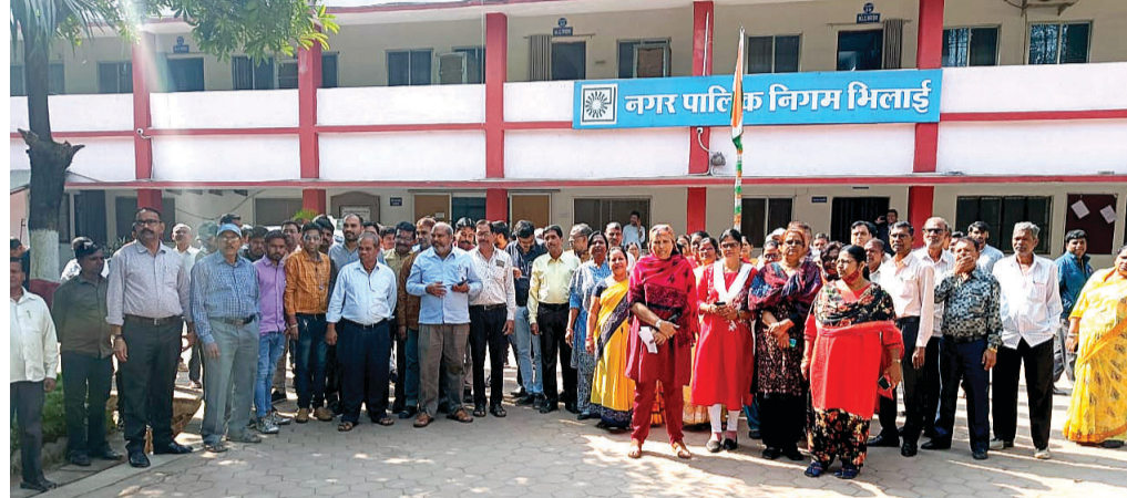
ही नहीं मिल पा रहा है तो शहर की दफ्तर में प्रदर्शन के दौरान कर्मचारियों अभाव्यवस्था सामने आ रही है। निगम जिम्मेदारी कैसे उठाएंगे। आज निगम का कहना है कि लगातार यह कर्मचारियों को समय पर वेतन नहीं

निगम के कर्मचारी संघ के नेतृत्व में सभी कर्मचारियों ने आज काम बंद कर दिया है। कर्मचारियों में इस बात की नाराजगी है कि निगम में उनका वेतन