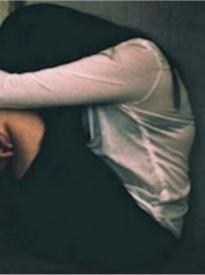
शादी का झांसा देकर किया दुष्कर्म

बिलासपुर। छत्तीसगढ़ में एक दुष्कर्म पीड़िता का आरोपी युवक ने फोटो और घर का पता फेसबुक में डालकर वायरल कर दिया है। आरोपी यहाँ नहीं रूका उसने युवती को धमकाते हुए कहा अगर शिकायत वापस नहीं लिया तो वह उसको कहीं न कहीं छोड़ेगा। इस कदर बदनाम करेगा कि उसके घर वाले भी शहर छोड़ने पर मजबूर हो जाएंगे। यह मामला बिलासपुर के सिविल लाइन थाना क्षेत्र का है।