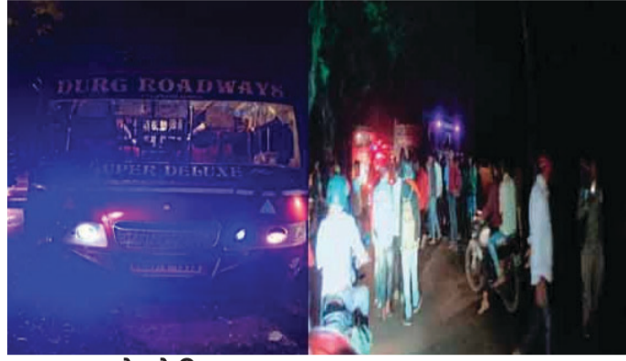
बस चालक ने छो दिया संतुलन

भिलाई। दुर्ग जिले में एक बेकाबू बस ने बाइक सवार तीनों लोगों को अपनी चपेट में ले लिया। जिससे तीनों ग्रामीणों की मौके पर ही मौत हो गई। यह भीषण सड़क हादसा बुधवार रात ननकड़ी गांव के पास की है। मिली जानकारी के अनुसार तीनों मृतक एक ही बाइक पर सवार होकर मेड़सरा गांव जा रहे थे। इधर घटना के बाद गुस्साए ग्रामीणों ने बस में जमकर तोड़फोड़ कर दिया। जिसकी सूचना मिलते ही तुरंत मौके पर नदिनी थाना पुलिस पहुंची। ग्रामीणों को किसी तरह शांत कराकर शवों को अपने कब्जे में लिया।