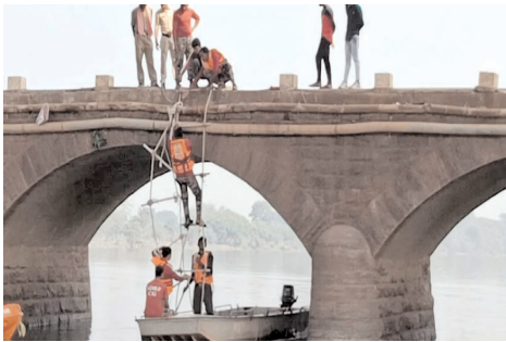
बाद राहत व बचाव कार्य का एक मॉकड्रिल दिखाया गया।

दुर्ग। शिवनाथ नदी में शुकुवार की सुबह बड़ा हादसा हो गया। मौके पर पहुंची एसडीआरएफकी टीम ने पहुंचते ही राहत एवं बचाव का काम शुरू कर दिया। एसडीआरएफकी टीम ने संभावित जगह पर तलाश शुरू की। इस दौरान नदी के चारों ओर लोगों की भारी भीड़ जमा हो गई। हालांकि की लोगों भी यह पता नहीं था यहां कोई हादसा हो गया। दरअसल यहां पर एसडीआरएफकी टीम ने किसी भी हादसे के