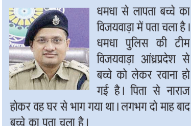
धमधा से लापता बच्चे का विजयवाड़ा में पता चला है। धमधा पुलिस की टीम विजयवाड़ा आंध्रप्रदेश से बच्चे को लेकर रवाना हो गई है। पिता से नाराज होकर वह घर से भाग गया था। लगभग दो माह बाद बच्चे का पता चला है।

उसके स्कूल में भी पूछताछ की गई। स्कूल से पता चला कि बच्चा पढ़ने में कमजोर है लेकिन काफ़ी बड़बोला है। बड़ी बड़ी बातें करता रहता है। इससे पुलिस को आशंका भी हुई कि बच्चा कहीं भाग गया हो। इसके लिए आरपीएफ व जीआरपी से भी संपर्क किया गया था।