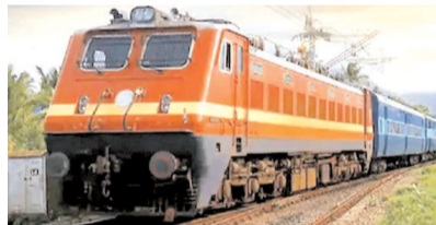
मिल चुकी है। मंत्रालय की ओर से उन्हें 13 अगस्त को दोपहर 12 बजे निर्धारित स्थान पर ट्रेन को हरी झंडी दिखाने कहा गया है।

अंतागढ़। दक्षीणजहरा-रावघाट रेल लाइन का काम सुरक्षा बलों की मौजूदगी में किया जा रहा है। अंतागढ़ तक बन चुके रेल लाइन पर अब ट्रेन चलाने की तैयारी है। कांकेर जिले के केंवटी तक चल रही ट्रेन को विस्तार करते हुए अंतागढ़ तक चलाने रेल मंत्रालय से मंजूरी मिल गई है। आजादी की 75वीं वर्षगांठ से 2 दिन पहले यात्रियों को यह सौगात मिलेगी। नक्सल प्रभावित क्षेत्र में रेललाइन विस्तार का काम 2016 से शुरू किया गया है। अंतागढ़ से ट्रेन शुरू होने से वनाचल क्षेत्र के लोगों को बड़ी सुविधाएं मिलेंगी। वहीं सड़क मार्ग की अपेक्षा किराया भी कम लगेगा।