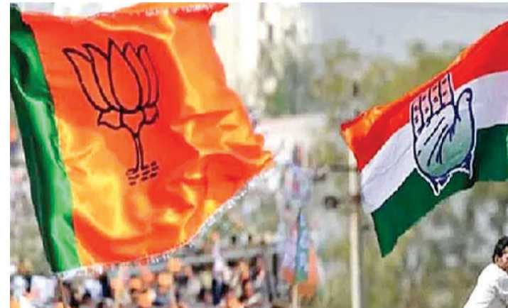
सोशल मीडिया अकाउंट में डीपी और प्रोफाइल पिक लगाने की अपील की है। इधर सीएम भूपेश बघेल ने कहा कि 9 अगस्त से भारत छोड़ो आंदोलन की शुरुआत हुई थी। 9 से 15 तारीख तक कांग्रेस पार्टी भी 75 किलोमीटर पदयात्रा करेगी। यह आयोजन प्रदेश के हर विधानसभा में होगा।