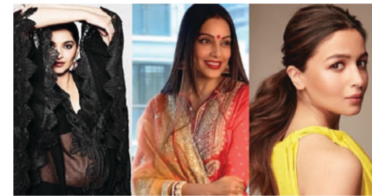
सोनम कपूर और आनंद आहूजा ने अपने आने वाले फर्स्ट चाइल्ड की खुशखबरी साझा की थी। सोनम कपूर ने पति आनंद सोशल मीडिया के जरिए फैंस के साथ साझा की थी। सोनम कपूर ने पति आनंद

बॉलीवुड अभिनेत्री बिपाशा बसु और करण सिंह ग्रोवर को लेकर आज जानकारी सामने आई कि कपल जल्द ही अपने पहले बच्चे का स्वागत कर सकते हैं। यह खबर आने के बाद फैंस काफी एक्साइटेड हैं, हालांकि अभी दोनों में से किसी ने भी इस बात को लेकर आधिकारिक घोषणा नहीं की है, लेकिन उम्मीद है कि कपल भी जल्दी ही फैंस के साथ अपनी ये खुशी साझा करेगा। फिलहाल इस साल कई सेलेब्स माता-पिता बनने जा हैं, तो चलिए जानते हैं, उन अभिनेत्रियों के बारे में जिन्होंने साल 2022 में दी प्रेग्नेसी की गुड न्यूज।